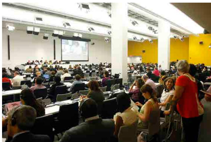
Tercera conferencia de los Estados Partes en la Convención sobre los Derechos de las Personas con Discapacidad.

Secretario General de las Naciones Unidas (2012).