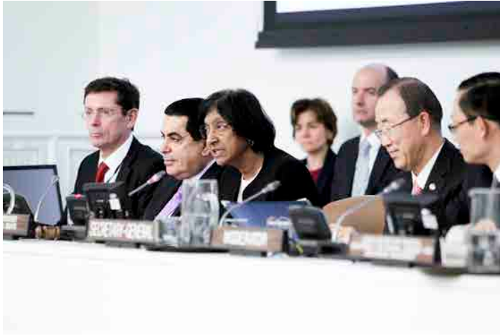
Navi Pillay, Alta Comisionada de las Naciones Unidas para los Derechos Humanos, habla en las consultas a los Estados Parte para fortalecer los órganos de tratados de derechos humanos. (2012).

http://www.ohchr.org/SP/HRBodies/Pages/HumanRightsBodies.aspx o http://bit.ly/18SoOwf Material didáctico complementario (vídeo): http://bit.ly/1fG47se